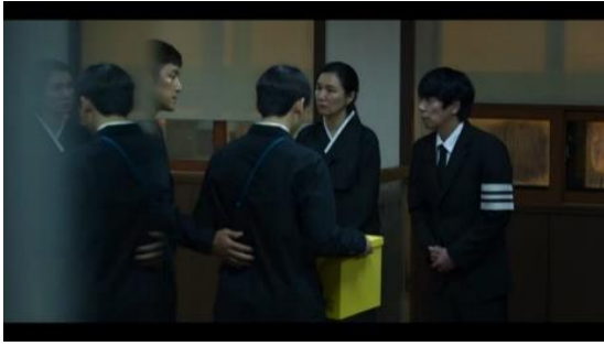
Gambar 1. Scene dalam web series Move to Heaven