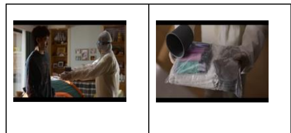
Gambar 4. Episode 2 Durasi: 22:01-22:16