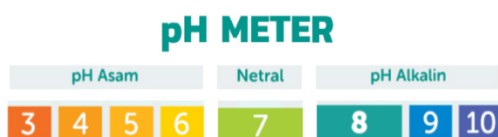
Gambar 1. Tingkat pH Air

Tubuh manusia terdiri dari 70% air. Atas dasar itu, air minum menjadi kebutuhan utama bagi asupan tubuh bahkan disarankan untuk mengonsumsi hingga 8 gelas sehari untuk mencukupi kebutuhan tubuh.