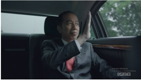
Gambar 2 Jokowi Melambaikan Tangan kepada Masyarakatnya

Pada Gambar 2 di atas menunjukkan ekspresi seorang laki-laki yang sedang tersenyum dan melihat ke arah kiri luar kaca mobil. Pada gambar tersebut juga memperlihatkan bahwa seorang laki-laki itu melambaikan tangan ke arah luar mobil. Laki-laki itu menggunakan jas hitam, kemeja putih dan dasi berwarna merah. Rambut pada laki-laki didalam video tersebut tertata rapi. Teknik pengambilan gambar ini diambil secara low angle dan medium shot.