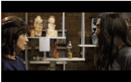
Gambar 3 Adegan dalam Film Toko Barang Mantan Durasi: 01.09.07