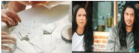
Gambar 1 Film Toko Barang Mantan

Alaudin. Film ini menggambarkan sebuah toko yang menjual benda-benda bernilai sejarah terutama benda pemberian dari mantan kekasih. Hal itulah yang membuat spesial dari toko ini. Orang yang ingin menjual barang dari mantannya ke toko tersebut wajib menceritakan sejarah dari benda tersebut.