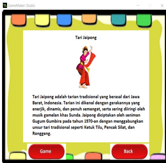
Gambar 3. Contoh Deskripsi Setiap Tarian

Gambar 2 merupakan halaman awal game . Pada halaman awal ini, disajikan 3 (tiga) tari daerah yaitu Tari Jaipong, Tari Serimpi, dan Tari Piring. Pengguna dapat memilih tari yang ingin dimainkan. Pada halaman awal juga dilampirkan petunjuk bermain serta 2 (dua) tombol yaitu tombol mulai dan tombol keluar. Saat pengguna akan mulai permainan, maka dapat memilih tombol mulai. Namun apabila ingin menyelesaikan permainan maka dapat memilih tombol keluar. Tampilan permainan disusun dengan cara yang sederhana sesuai dengan rencana target pengguna dari game .