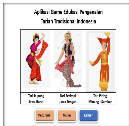
Gambar 2. Tampilan Awal Game

Game edukasi pengenalan Budaya ini dirancang dengan tujuan untuk memperkenalkan berbagai macam Budaya kepada para murid SD. Aplikasi ini menawarkan pengalaman belajar yang interaktif dan menyenangkan melalui game edukasi. Setiap bagian dari aplikasi ini didesain dengan mempertimbangkan preferensi dan tingkat pemahaman anak-anak SD (kelas 1 s.d 2), sehingga menciptakan lingkungan pembelajaran yang menarik dan mudah dipahami bagi mereka. Hasil penelitian ini adalah berupa aplikasi media dan game edukasi pengenalan budaya dengan tampilan awal sebagai berikut: