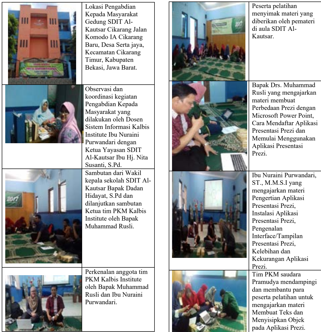
Tabel 1. Dokumentasi Kegiatan Pengabdian Masyarakat 10 April 2017