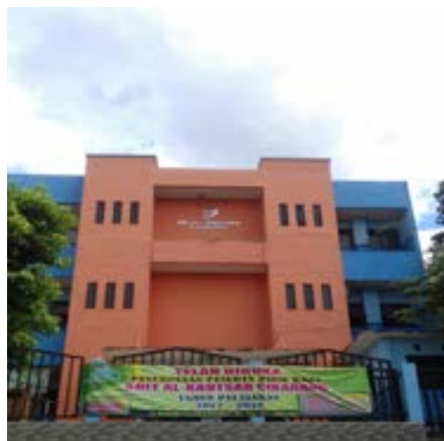
Gambar 1. Gedung SDIT Al-Kautsar Cikarang

Sebagai program studi yang terkait dengan bidang teknologi dan bisnis maka Prodi Sistem Informasi Kalbis Institute sangat antusias untuk ikut berpartisipasi dalam kegiatan PKM dengan SDIT Al-Kautsar.