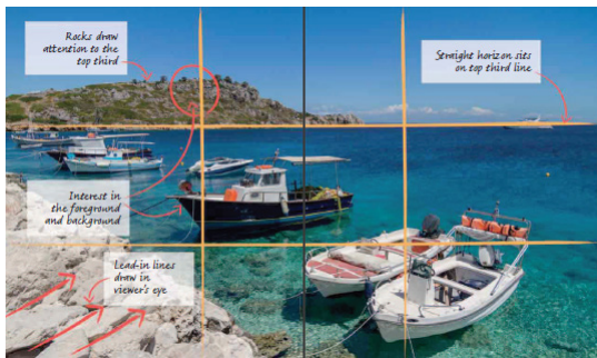
Gambar 2. Contoh The Rule of Thirds