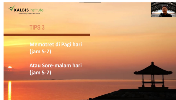
Gambar 7. Materi The Rule of Thirds

Berbeda dengan ilmu fotografi yang sifatnya teknis, the golden hour lebih condong ke arah tips n' trick dalam fotografi. Pasalnya the golden hour sangat mengandalkan available light atau pencahayaan alami yang tidak bisa dibuat oleh fotografer. Kita hanya bisa memperkirakan waktu di mana biasanya efek the golden hour muncul. Hal ini penting untuk diketahui karena di waktu-waktu ini lah pencahayaan alami paling baik dibandingkan waktu-waktu lainnya. seperti pada gambar 7.