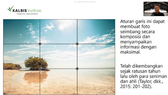
Gambar 6. Materi The Rule of Thirds

Materi berikutnya yang disampaikan adalah tentang The Golden Hour , yaitu sharing waktu di mana pencahayaan terbaik dari available light , yaitu pukul 5-7 pagi, dan 5-7 sore waktu Indonesia.