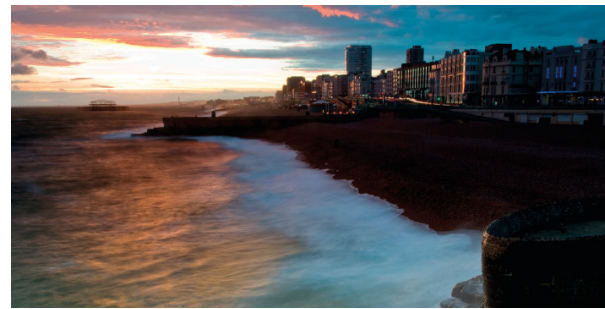
Gambar 3. Contoh The Golden Hour

satu frame foto menjadi sembilan bagian yang semuanya sama rata.