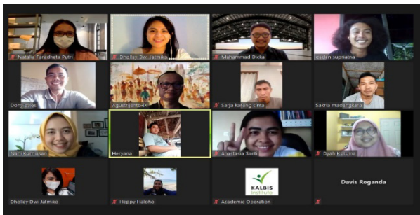
Gambar 4. Proses Penyampaian Materi Melalui Zoom Meeting Sumber: Dok. Peneliti

perangkat smartphone , dan tujuan dari smartphone photography . Hal ini ditujukan untuk memberikan pemahaman kepada mitra PKM bahwa smartphone photography merupakan hal yang cukup penting untuk dipelajari. Meskipun terkesan ringan dan sudah menjadi kebiasaan sehari-hari, namun tidak menutup kemungkinan bahwa cara mengambil gambar yang selama ini dilakukan sebenarnya belum maksimal. Proses penyampaiannya dapat dilihat pada Gambar 4,