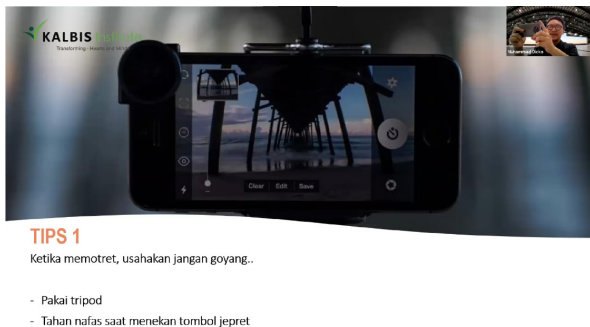
Gambar 5. Materi Dasar Smartphone Photography

Setelah memahami pentingnya pemahaman dasar dari smartphone photography beserta tujuannya, pemateri kemudian memberikan tips-tips paling dasar dalam mengambil foto menggunakan smartphone , yaitu diusahakan untuk tidak shaking atau goyang, dan diusahakan untuk tidak miring. Kedua hal ini menjadi dasar paling awal karena kebanyakan masyarakat memotret tidak memerhatikan aspek steadiness (tidak goyang) juga aspek kelurusan. seperti pada gambar 5.