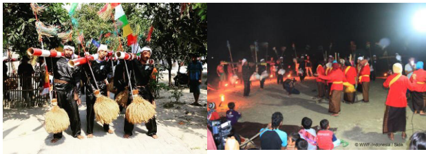
Gambar 3. Aktivitas pagelaran seni dan budaya

Sambil menari, seorang penari akan bernyanyi dengan lirik bahasa Sunda diikuti oleh penari lain sambil mengikuti irama dan berputar mengelilingi para penari lainnya yang sedang menumbuk padi. Dapat dilihat pada Gambar 3.