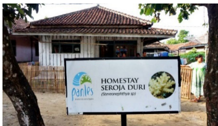
Gambar 4. Homestay di Kampung Paniis

Kampung Paniis juga menyediakan fasilitas dan sarana penginapan berupa Homestay dengan suasana ciri khas rumah sederhana di pedesaan pesisir pada umumnya serta disediakan makan sebanyak 3x sehari. Seperti pada Gambar 4.