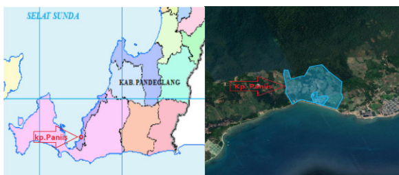
Gambar 1. Peta Wilayah Kampung Paniis, Kab. Pandeglang, Banten

Kecamatan Sumur, Kabupaten Pandeglang, Provinsi Banten. Kampung Paniis berada di Desa Tamanjaya yang sebagian daerah wilayahnya masuk kedalam wilayah zona pemanfaatan Kawasan Taman Nasional Ujung Kulon (TNUK) Banten. Kampung Paniis sendiri memiliki luas keseluruhan \pm 866.760 \text{ m}^2 dengan luas wilayah huni \pm 62.742 \text{ m}^2 serta untuk luas lahan persawahan kurang lebih 494.793 \text{ m}^2 dan 309.225 \text{ m}^2 yang masuk ke dalam zona wilayah Kawasan Taman Nasional Ujung Kulon, Banten. Sebagian besar pekerjaan penduduk desa di Kampung Paniis adalah petani dan sisanya ada yang bekerja di luar kampung dan sebagian lagi menjadi nelayan. Peta Wilayah Kampung Paniis, Kab. Pandeglang, Banten seperti pada Gambar 1.